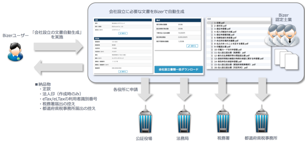
「会社設立のマキトリ」サービス概要

これまでの「会社設立の文書自動生成」では、必要書類の調査や作成にかかっていた約 15 時間の時間を削減しており、今回は各役所に書類を提出する実務の約 5 時間を削減し、会社設立にかかる実務 20 時間を削減します（Bizer ユーザーのトライアル調査より）。